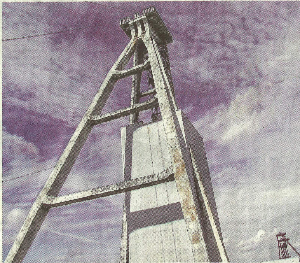
Les chevalements Joseph (au fond) et Else resteront-ils debout pour pouvoir assurer, comme le demande le rapport, "une surveillance au plus près des déchets toxiques" ?